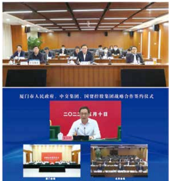
中交集团与厦门市签订深化战略合作框架协议

5月10日,中交集团与厦门市签订深化战略合作框架协议,中交集团与国贸控股集团签订合资合作战略框架协议。签约仪式以书面签约、线上见证的形式举行,市委书记崔永辉、市长黄文辉与中交集团董事长王彤宙、总经理王海怀分别在厦门、北京会场出席活动。