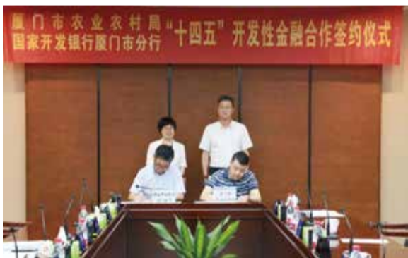
与厦门市农业农村局签订