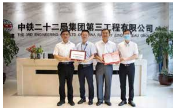
厦厦门提供更加便利的政策支持。

据了解，按照厦门市相关规定，被授予“纳税特大户”荣誉的企业，其骨干员工可享受厦门市保障性住房、子女入学等政策照顾，这将为公司骨干员工安