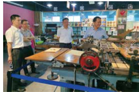
参观考察云创智谷

云创智谷以“科创+台创+新零售”为产业核心，以链条式孵化空间为载体，通过“园区服务+创业服务+产业服务+社群服务”相结合的“一核多元”服务体系，打造新经济产业平台和全国双创园区领导品牌。