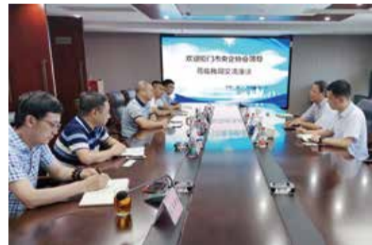
走访中铁（厦门）投资公司

厦门地铁3号线机电工程、厦漳同城大道、莆田妈祖城项目、莆田涵江市政项目等，涉及土地一级开发、市政道路桥梁公路工程 and 地铁等项目，总合同额151.86亿。