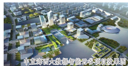
中直海西大数据智能云谷项目效果图