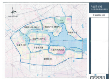
马銮湾重点招商区域规划图

铁站点1平方公里人才房已开工建设，抓紧建设生活配套设施，是新城最成熟的综合服务配套区域之一。北部片区，军民融合产业园正在进行园区道路和相关配套设施建设。信息科技产业园正在开展园区建设前期工作。中部片区，马銮湾中心岛、集美岛正在施工建设，计划开展总部经济、高端商务、高端会议等项目的招商。