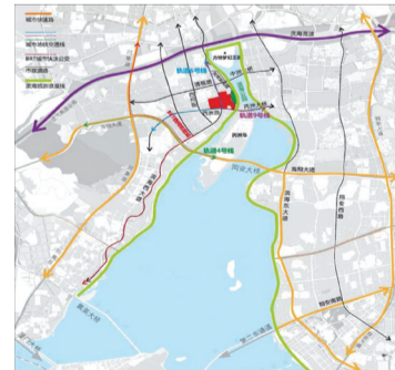
现代服务业基地（丙洲片区）区位