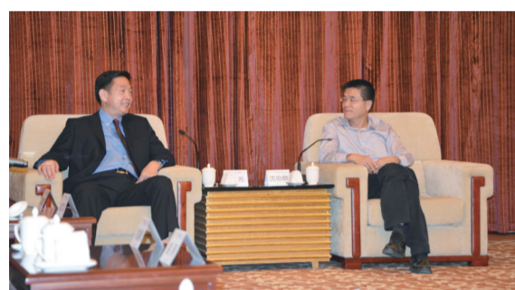
涵江区委书记沈伯麟(右)与黄光会长座谈(左)

随后, 黄光会长、谢文沧秘书长一行在沈伯麟书记的陪同下, 参观考察了涵江港、中涵机动力有限公司、涵江国际商贸城等地。涵江区区长陈万东、涵江区委副书记李文福, 涵江区副区长李晶, 以及中航国际厦门公司党委书记陈兹勇、人力资源部经理刘晨博、行政部经理胡涛等陪同考察。 【本报通讯员: 吴小青】