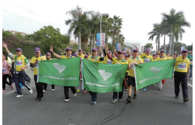
国控星鲨公司组队参加2014年厦门国际马拉松赛