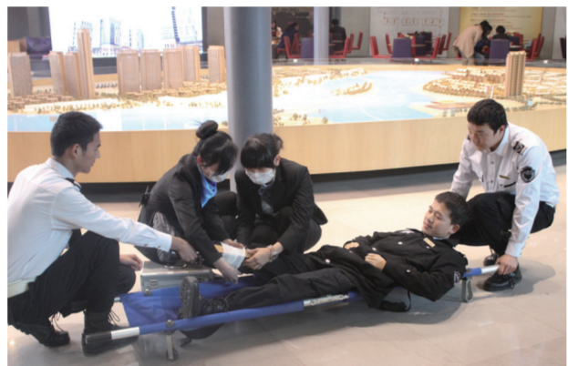
图为救护组在进行消防抢救演练