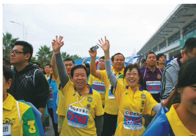
中铁一局厦门公司员工在厦门国际马拉松赛中一展风采

1月2日清晨的厦门，天刚蒙蒙亮，鼎沸的人声透过薄雾从滨海的国际会展中心传来。熙熙攘攘的人群中不难发现身披蓝色“战袍”的队伍，头顶上飘扬着“中铁一局厦门公司为马拉松加油喝彩”的蓝色旗帜。这是本会会员单位——中铁一局厦门公司员工第三次参赛厦门国际马拉松，人数多达148人。与往年不同的是，此次除89人参与五公里项目外，更有59人挑战10公里赛程，当天出赛的员工均在比赛时间内抵达目的地。