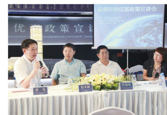
央企协会黄光会长(左一)与央企代表及政府部门领导就总部企业认定条件进行交流