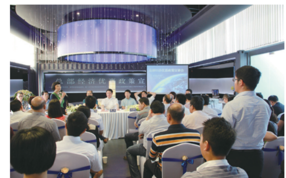
央企协会会员代表与政府部门领导就总部经济优惠政策进行交流