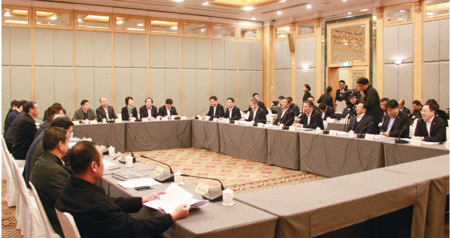
福建省常委、厦门市委书记王蒙徽,市长刘可清会见了中航工业集团公司董事长、党组书记林左鸣一行。

3月14-15日期间,中航工业集团公司董事长、党组书记林左鸣,副总经理顾惠忠、吴献东一行,还到漳州市、诏安县、东山县和漳州台商投资区实地考察相关投资项目选址和推进情况,并与漳州市委书记陈家东、市长檀云坤和诏安县、东山县等地方领导会晤。中航国际总裁吴光权以及中航国际高级副总裁、中航国际厦门公司总经理黄光全程陪同。