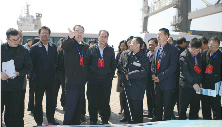
福建省常委、政法委书记苏增添（左四），厦门市市长刘可清（左三）一行，听取远海码头总经理张俊生（左五）关于远海自动化码头建设情况的汇报。

2月21日上午,福建省常委、政法委书记苏增添等30余位福建省全国人大代表一行莅临远海码头现场视察并听取远海自动化码头建设进展情况。厦门市市长刘可清作为此次全国人大代表参加视察活